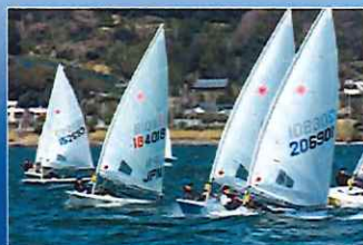
セーリング・チャレンジカップ IN 浜名湖 毎年3月にジュニア年代を対象としたセー リング大会を開催しています