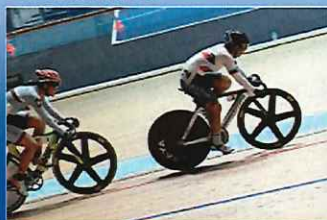
スポーツチャレンジ助成 スポーツを通じてチャレンジする人を応援 しています