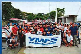
ジュニアヨットスクール葉山 神奈川県葉山町で活動しているジュニア 対象のヨットスクールです