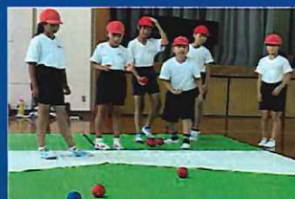
チャレンジ! ユニ★スポ 「相互理解促進と共生社会実現」を目的と した体験授業です