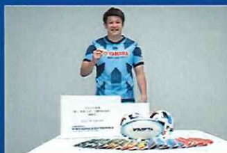
スポーツ教材の提供 子どもたちのスポーツ機会充実に向けた 教材を提供しています