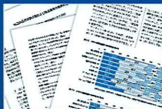
調査研究 障害者スポーツ、トップスポーツ等の調査 研究活動を行っています