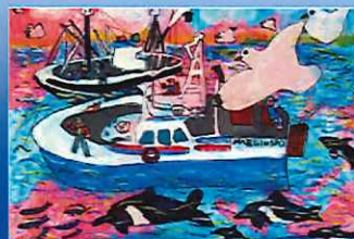
水辺の風景画コンテスト 絵画コンテストを開催し子どもたちの自然 体験活動を促進しています