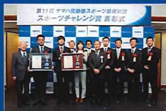
スポーツチャレンジ賞 スポーツ分野における「緑の下の力持ち」を 表彰しています